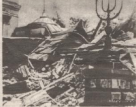
ממראות ליל הבדולח

בימים אלו נציין 66 שנה לפוגרום "ליל הבדולח" הנורא, בו נשרפו מאות בתי כנסת ונעצרו יהודים רבים. בן מיכאל מציג מכתב שכתב הרב לוינר אשר נכח בשעת הפוגרום ונדהם ממראה עיניו