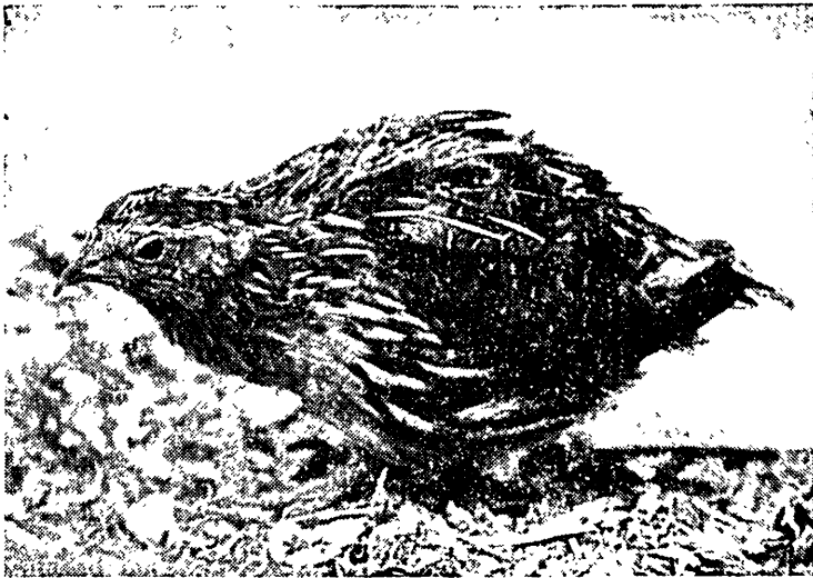
מראה השלו המבוית

גידול זה, כיון שרצוי שמישראל יצאו מצרכים כשרים במקום נבלות ואיסורים. מאידך, אם אין להתיר עוף זה יש להמנע מלגדלו ויש צורך לעכב את התפתחות הענף כיון שלא רצוי שמשווקי ישראל ייצאו איסורי אכילה לעולם. במקרה זה יש להתייחס לגידול השלו כשם שיש להתייחס לגידול הארנבת לבשר.