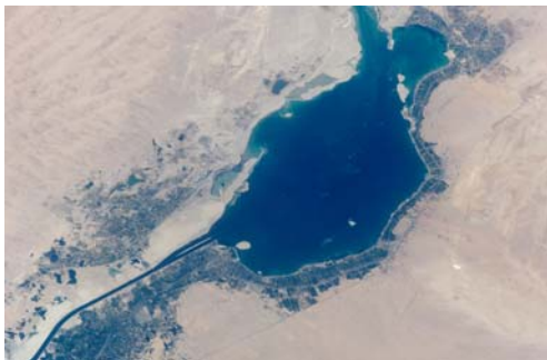
האגם המר הגדול – "ים של קנים וסוף" (לפני ההמלחה של תעלת סואץ)

בדרך כלל "ים-סוף" הוא שמו של הים האדום ובייחוד של לשון הים שבין מצרים ולחצי האי סיני. ואולם יש ואגם מכונה: 'ים סוף'. אחד האגמים שבין מצרים לישראל מכונה כך. אולי האגם המר הגדול הוא הים המכונה: "ים-סוף". בטרם היות תעלת סואץ היו מימיו מתוקים ולחופו צמחו קנים וסוף. לפי השערות אחדות זהו הים שאותו חצו בני ישראל ביציאת מצרים. ים סוף כאן מקביל לים סוף שבפרשת בשלח.