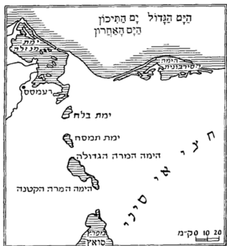
מפת הימות שבין חצי האי סיני לבין מצרים

'נהר מצרים' הוא הנילוס. מדובר כאן, כנראה, על הזרוע המזרחית של נהר הנילוס, זרוע שעברה ממזרח לפלוסיון, (אל-פרמה), ונשפכה לים התיכון ממערב לימת ברדוויל. זרוע זו יבשה בתחילת התקופה הערבית. ואינה קיימת כיום. קרן זו מכונה בפסוק בפרשתנו בשם 'ים-סוף'. כלומר הציון ים סוף מקביל לנהר מצרים. (ראה פירושו של קאסוטו על ספר שמות עמוד 109).