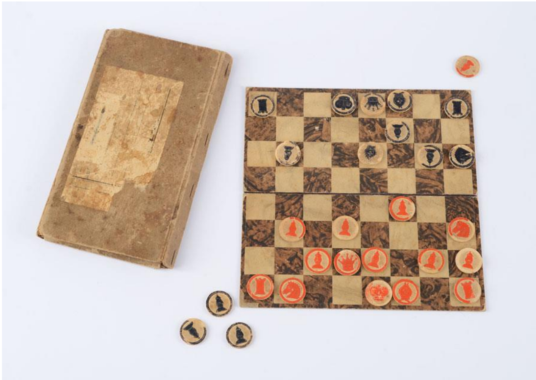
*הרמן ראוטנברג יהודי מברלין יצר כלי שחמט מנייר, במחנה ההשמדה בוכנוולד, שם הוצא להורג.