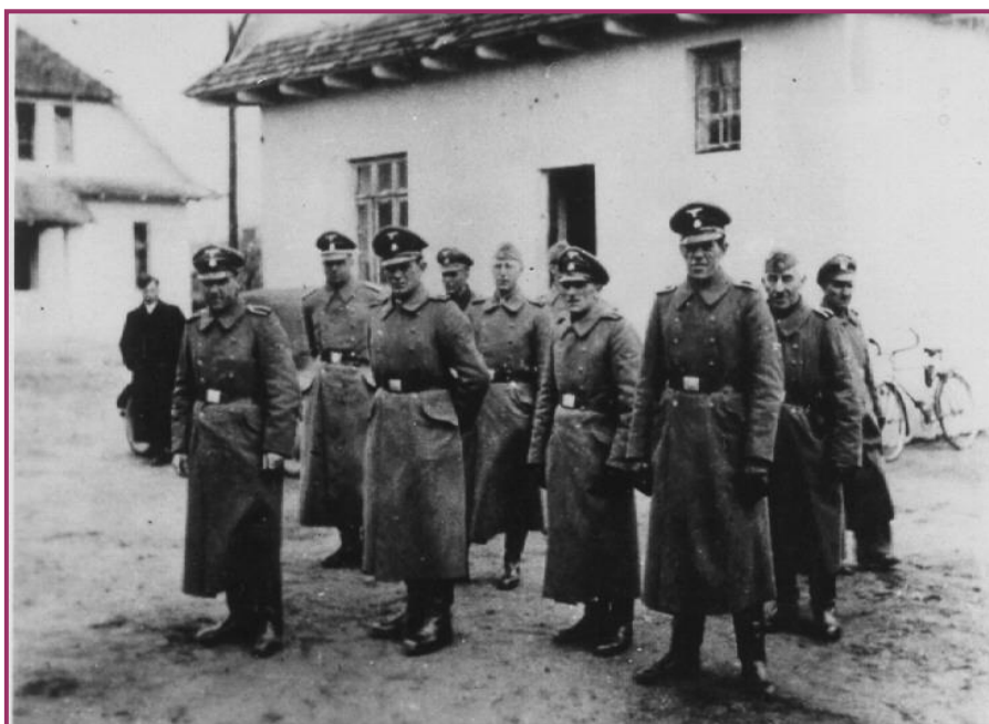
אנשי ס"ס במחנה ההשמדה בלז'ץ [ארכיון לוחמי הגטאות]

נובעות מזה סכנות רציניות לגופם ולחיהם, הנאשמים היו צריכים לקחת בחשבון שהממונים עליהם יקראו להם פחדנים או שהקריירה שלהם תיפגע. אי נעימויות כאלה לא היו עומדות בשום יחס לחייהם של מאות אלפי אנשים שניספו במחנה. באשר לטענת הנאשמים, שבמקרה של גילוי ייסורי המצפון שלהם, הם חששו שדווקא אז יכריח אותם מפקד המחנה, וביתר שאת, להשתתף בפעולות השמדה, אפשר להעריך טענה זו רק כטיעון לשם התגוננות. כפי שמראה השתלשלות העניינים במחנה בלז'ץ למעשה, נשלחו לפעולות שפלות במיוחד, כגון שירות ליד הבור, בדרך כלל רק אנשים שהוכיחו שהיו להם התכונות המתאימות לצורך זה.