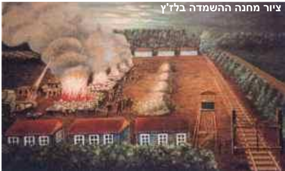
ציור מחנה ההשמדה בלז'ץ