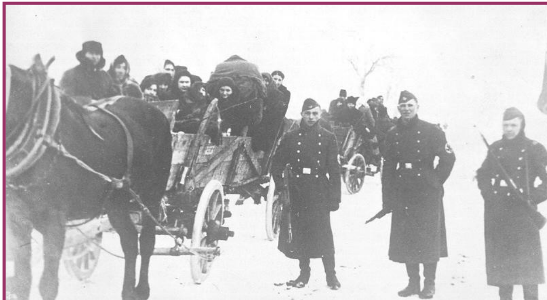
יהודים מגורשים בעגלות מסביבות לובלין למחנה ההשמדה בלז'ץ [ארכיון לוחמי הגטאות]

נפרדתי מהאנשים, שמסרו לי את הידיעות, והלכתי לי בדרך, שהייתה ידועה לי כ"מסילה הצדדית". המסילה לא הייתה כבר קיימת. השדה הוליך אותי עד ליער אורנים חי, נותן ריחות. שררה שם דומיה. בתוך היער נמצא שדה-יער גדול, בהיר. [4]