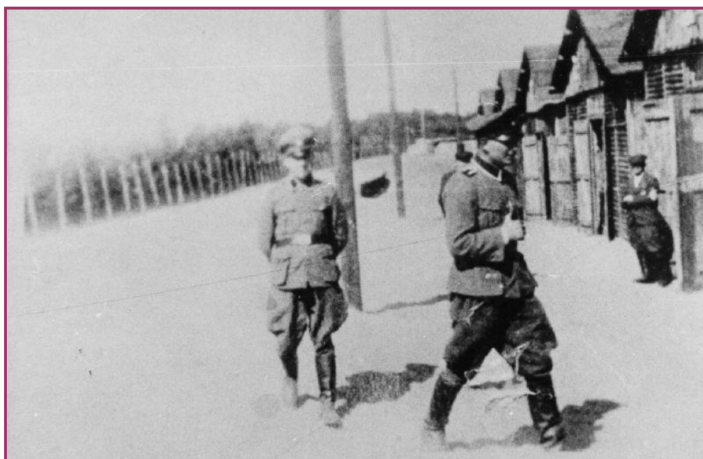
אנשי ס"ס בסיוור צריפים במחנה ההשמדה בלז'ץ

בפינה עומד איש ס"ס חזק שאומר למסכנים בקול פסטוראלי: "לא יקרה לכם דבר! עליכם רק לנשום עמוק בתאים, זה מרחיב את הריאות, השיאוף הזה נחוץ נגד מחלות ומגפות". לשאלה מה יקרה איתם, הוא ענה "כן, כמובן הגברים חייבים לעבוד, לבנות בתים וכבישים, אבל הנשים לא צריכות לעבוד. רק אם הן רוצות, הן יכולות לעזור במשק בית או במטבח"