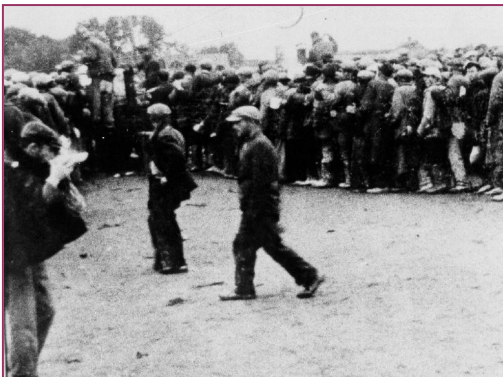
יהודים שהגיעו לבלז'ץ

קרוב לשעות הצהריים הגיעה הרכבת לתחנת בלז'ץ. הייתה זו תחנה קטנה. מסביב לה עמדו בתים קטנים. בבתים אלה גרו אנשי הגסטאפו. בלז'ץ נמצאת בקו המסילה לובלין, טומאשוב. היא מרוחקת מראווה-רוסקה 15 קילומטר. בתחנת בלז'ץ העבירו את הרכבת למסילה צדדית, שהובילה עוד קילומטר אחד ישר למחנה המוות. ליד התחנה גרו פועלי הרכבת האוקראינים ועמד שם בניין קטן של הדואר.