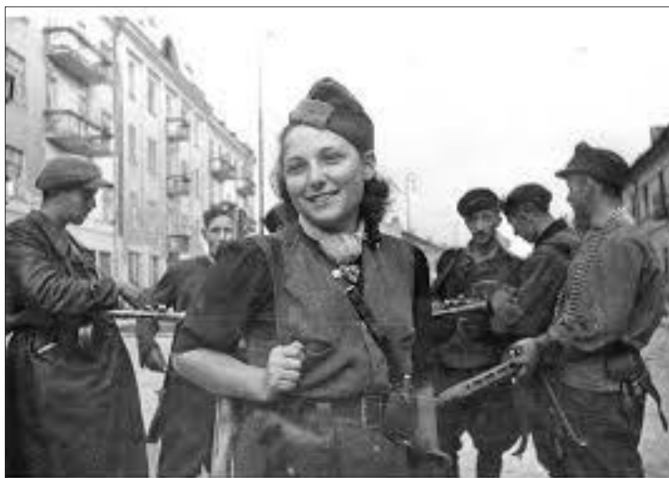
הפרטיזנית רחל רודניצקי עם עוד פרטיזנים חמושים ברחובות ווילנה בעת השחרור - 1944 [2]