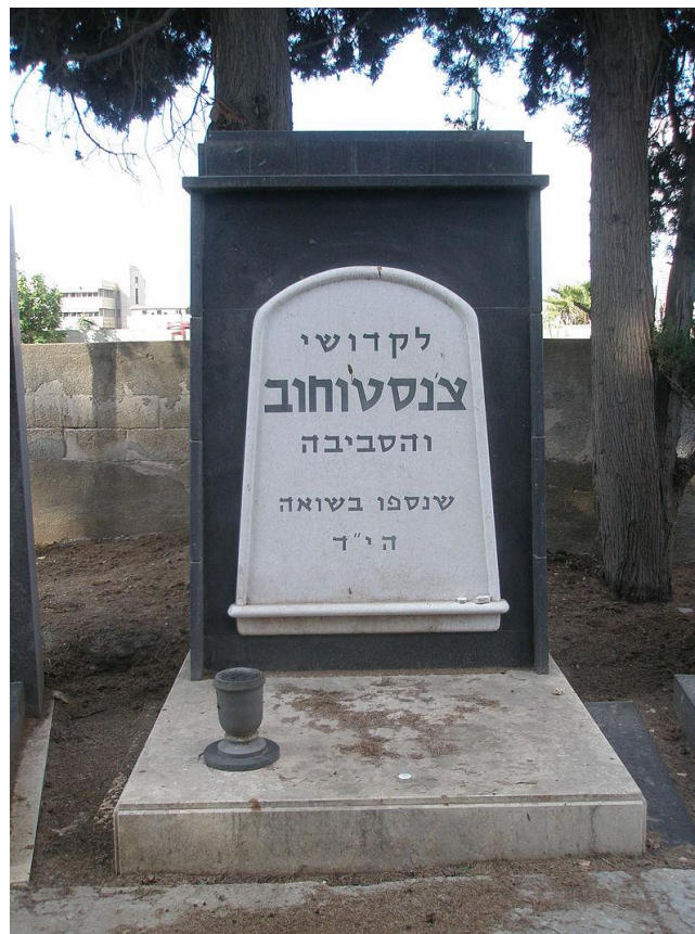
אנדרטה לזכרם של קדושי צ'נסטוחוב בבית העלמין בנחלת יצחק

מקור: "צ'נסטוחוב" {Czestochowa-1967} - ספר זיכרון, העורך: מ. שוצמן, הוצאת אנציקלופדיה של גלויות, תשכ"ט - 1968, עמ' 181 ואילך.