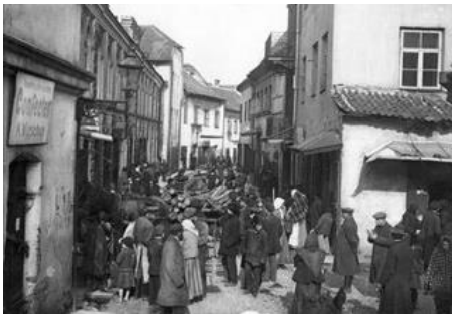
יהודים בתוככי גיטו ווילנה [2]

ב-24 באוקטובר וב-3-5 בנובמבר נערכו "אקציות השיינים הצהובים". אקציות אחדות בהיקף קטן יותר נעשו גם בחודש דצמבר והאחרונה הייתה ב-22 בדצמבר.