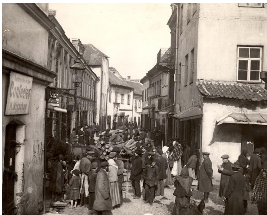
רחוב בגיטו ווילנה [2]