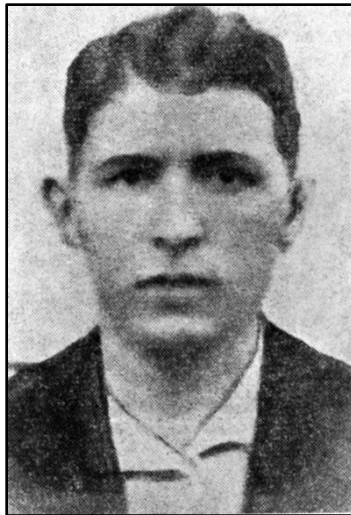
יצחק רוכצ'ין מנהיג המרד היהודי בגטו לחווא

כאשר נכנסו הגרמנים לגטו, הצית לופטין באש את מפקדת היודנראט ושלח צעירים להצית את יתר בתי הגטו ואת המחסנים שהוחזק בהם רכוש שהוחרם מהיהודים.