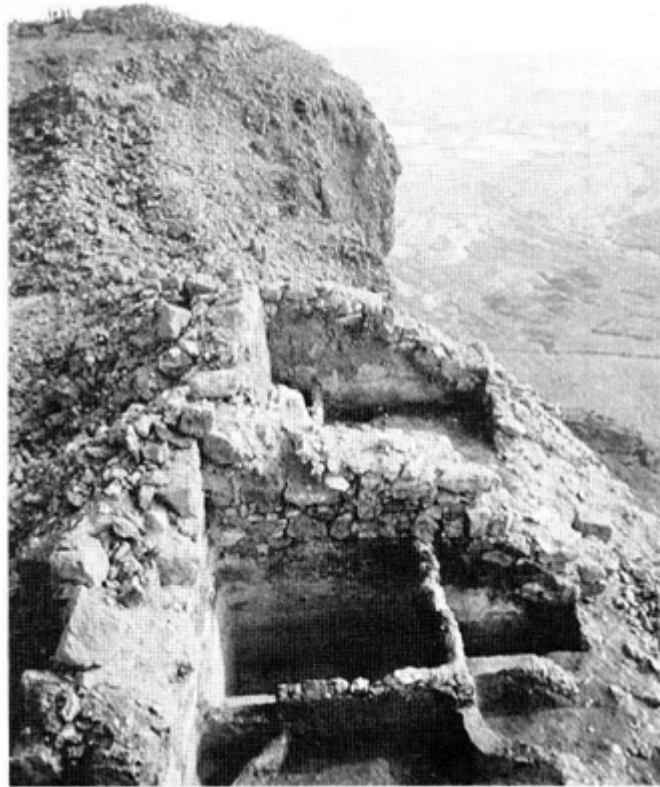
המקוה הדרומי במצדה