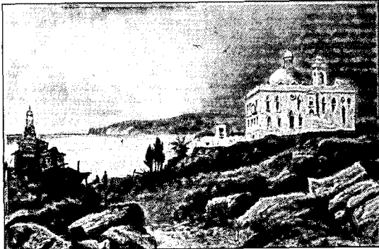
איור מתוך הספר "חיפה", מאת: לורנס אוליפנט

את הכביש וניגש אל מנזר הכרמליתים (2). המבנה הגדול והיפה נבנה על "ראש הכרמל" הידוע כמקום קדוש משחר ההיסטוריה. בדיקת המקורות ההיסטוריים מלמדת שקדושת הכרמל קדומה מאוד (לפחות מהמאה ה-15 לפני הספירה), והיא נשמרת מאז ועד היום. הקדושה עברה מאמונה אחת לחברתה, ומדת אחת לדת אחרת, וכל אחת מאלה שינתה והוסיפה גרסאות משלה לגבי קדושת המקום. כך עשו גם הנזירים הכרמליתים שהגיעו לכאן בתקופה הצלבנית - הם קיבלו את המסורות העתיקות והוסיפו במשך הזמן גרסאות משלהם. הכרמליתים, שהעריצו את דמותו של אליהו הנביא, קבעו אותו כפטרוֹן המסדר שלהם, ומכאן מובנת חשיבותו הרבה של "ראש הכרמל" לגביהם. עם התמוטטות ממלכת הצלבנים, הם נאלצו לברוח מארץ-ישראל, בסוף המאה ה-13. אמנם הם שבו לאירופה, אך המשיכו לקוות שיחזרו אל ארץ-הקודש. רק במאה ה-17 הדבר נסתייע בידם, ואחרי שנבצר מהם להתמקם במערת אליהו, הם בנו את המנזר בראש הכרמל, מעל למערה. הבנייה החלה בימי השליט הבודוי דהר אל עומר, בשנת 1767. באותה תקופה זכו הנזירים הכרמליתים לתמיכה ולחסות של מלך