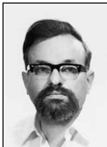
מועד כתיבה משוער: אמצע תשכ"א (פתמונה: שב"ד בתקופה בה נכתבו הדברים).

כל אותו הזמן חזרו המקורות העבריים להיות הנושא העיקרי של לימודי, ולא רק בתחום ההלכה, אלא גם בתחומים אחרים. בינתיים גם נשאתי אשה ונעשיתי אב לילדים. 24 משגמרתי את האוניברסיטה בתי"ד כמוסמך למשפטים, התקבלתי להתמחות במשרד המשפטים, וביקשתי להעסיקני בעניינים שבהם נזקק המשרד לחקר המשפט העברי. בהתאם לכך התקבלתי למחלקה לתכנון החוק, וכאן ניתנה לי האפשרות שלא להיפנות מלימודי אפילו לצורכי פרנסה. יתרון נוסף הוא, שכאן אין אני עוסק רק במשפט העברי כשלעצמו, אלא חייב אני לחקרו מתוך תשומת לב מפורשת לצורכי החיים האקטואליים ובהשוואה לשיטות משפט זרות. עד כה השלמתי במסגרת המחלקה הזאת שתי הצעות-חוק המבוססות לחלוטין על המשפט העברי – אמנם תוך מחקר מן הסוג האמור – והן: הצעה מקיפה ביחס לדיני הקניין במקרקעין, והצעת חוק בוררות. 25