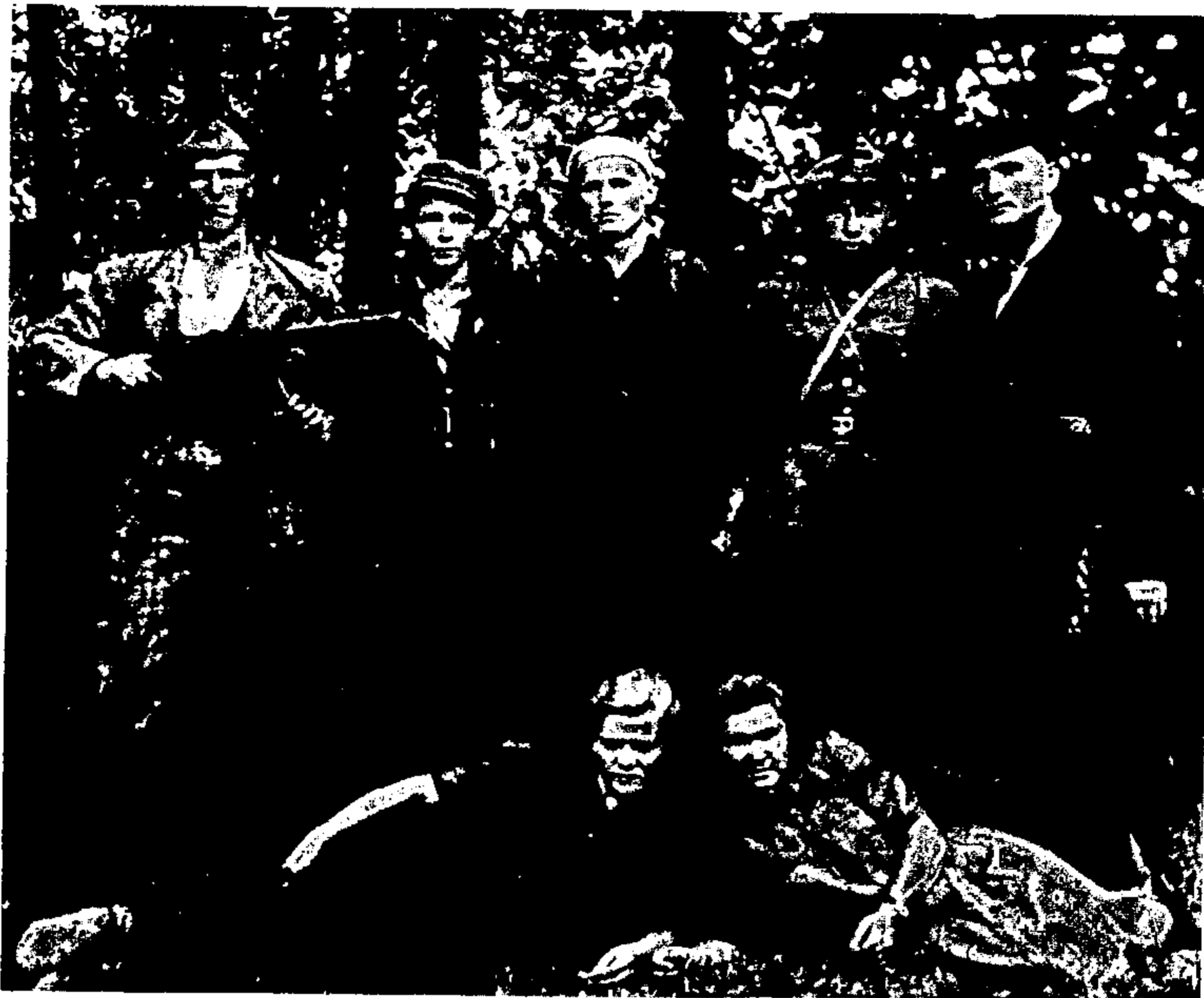
קבוצה של פרטיזנים ביערות ליטא.

הפרטיזניות עמדה נגד עינינו הבעייתיות המיוחדת לנושא זה, שבוטאה על-ידי אחד מראשוני החוקרים של השואה. הוא אומר: „מתוך גישה רומנטית חטאו שני המחנות, גם המחנה הלאומי וגם המחנה הקומוניסטי, לעקרונות המחקר המדעי, וסיפורי בדים שדרכם להיות צצים ונפוצים בתקופות משבר כאלה נתגלו עליהם כעובדות, בלי לבדוק את מהימנותם; להבא יקשה על איש-המדע להשתחרר מן המיתוס החדש, שכבר היכה שורשים עמוקים בתודעה ההיסטורית שלנו.“ 3 בעקיפין יש בדברים אלו כדי לרמוז גם לחוקר, שהוא עצמו נימנה בשעתו עם אותה מסגרת הנחקרת כיום על ידו. המסקנה שהתבקשה מכאן אכן הוסקה במיטב המאמצים: ביקורתיות יתר לגבי המקורות היהודיים כמו לגבי המקורות הלא-יהודיים. 4