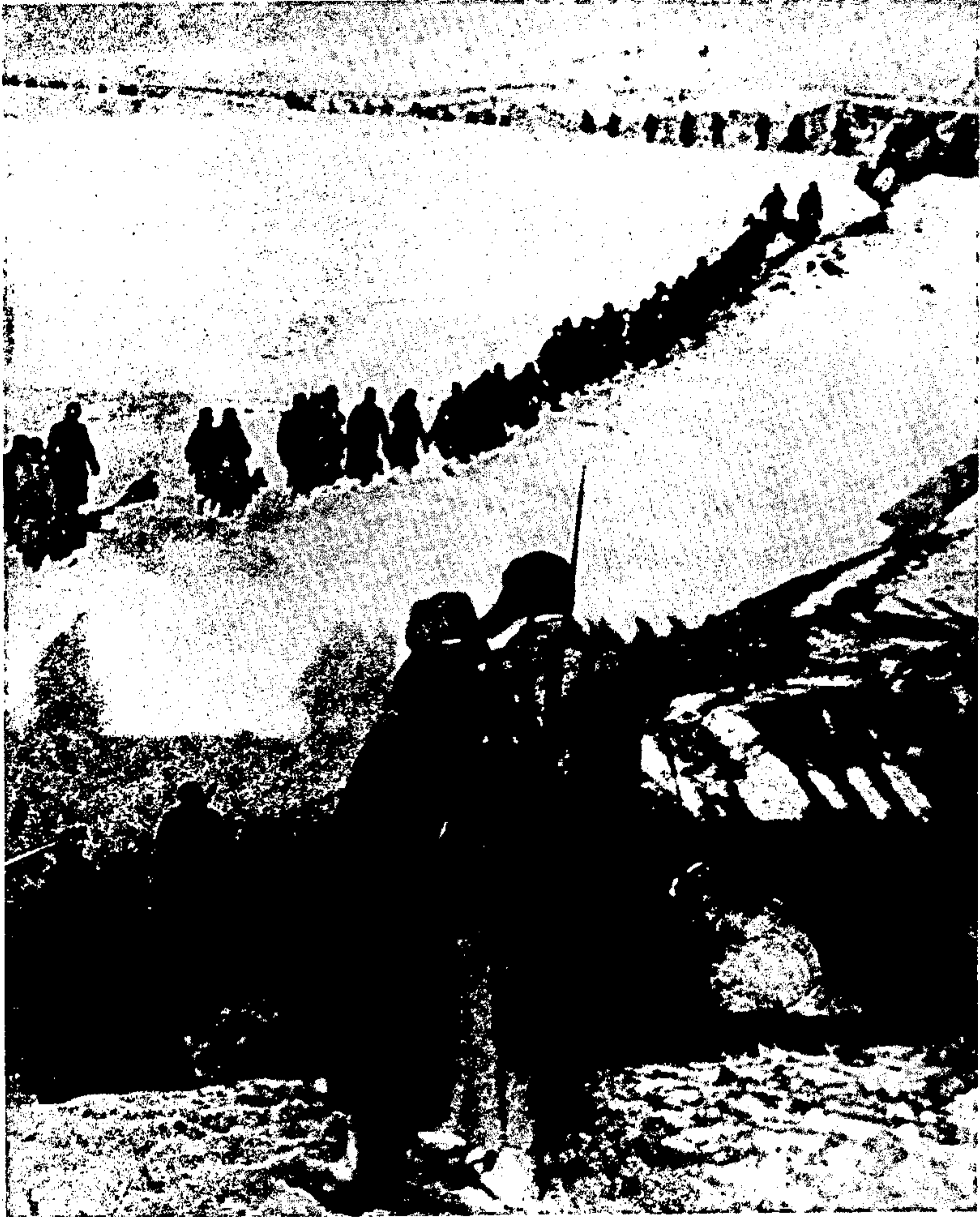
חיילי הדיביזיה הליטאית צועדים בשלג, בחזית אורל, פברואר 1943.

בנוסף למניעים הערכיים שמכוחם התגייסו היהודים מליטא לדיביזיה, גרמה גם תקופת האימונים הממושכת יחסית (שלא היתה מקובלת אז ביחידות אחרות) לכך, שהחיילים „יצפו לקרב בדריכות“. הואיל ורובם טרם התנסו בקרב, לפחות לא במימדים של חורף 1943, נוסף גם גורם הסקרנות וההתלהבות, עד כדי כך ש„הלכו לחזית כאילו הולכים לריקוד ולא היה פחד“. גם אם מימדי הכשלון של הקרבות הראשונים, שמוקדו העיקרי היה בכפר אלקסייבקה, השכיחו את ההתלהבות משרידי הלוחמים שעלו על מוצב זה שנית בקיץ 1943,