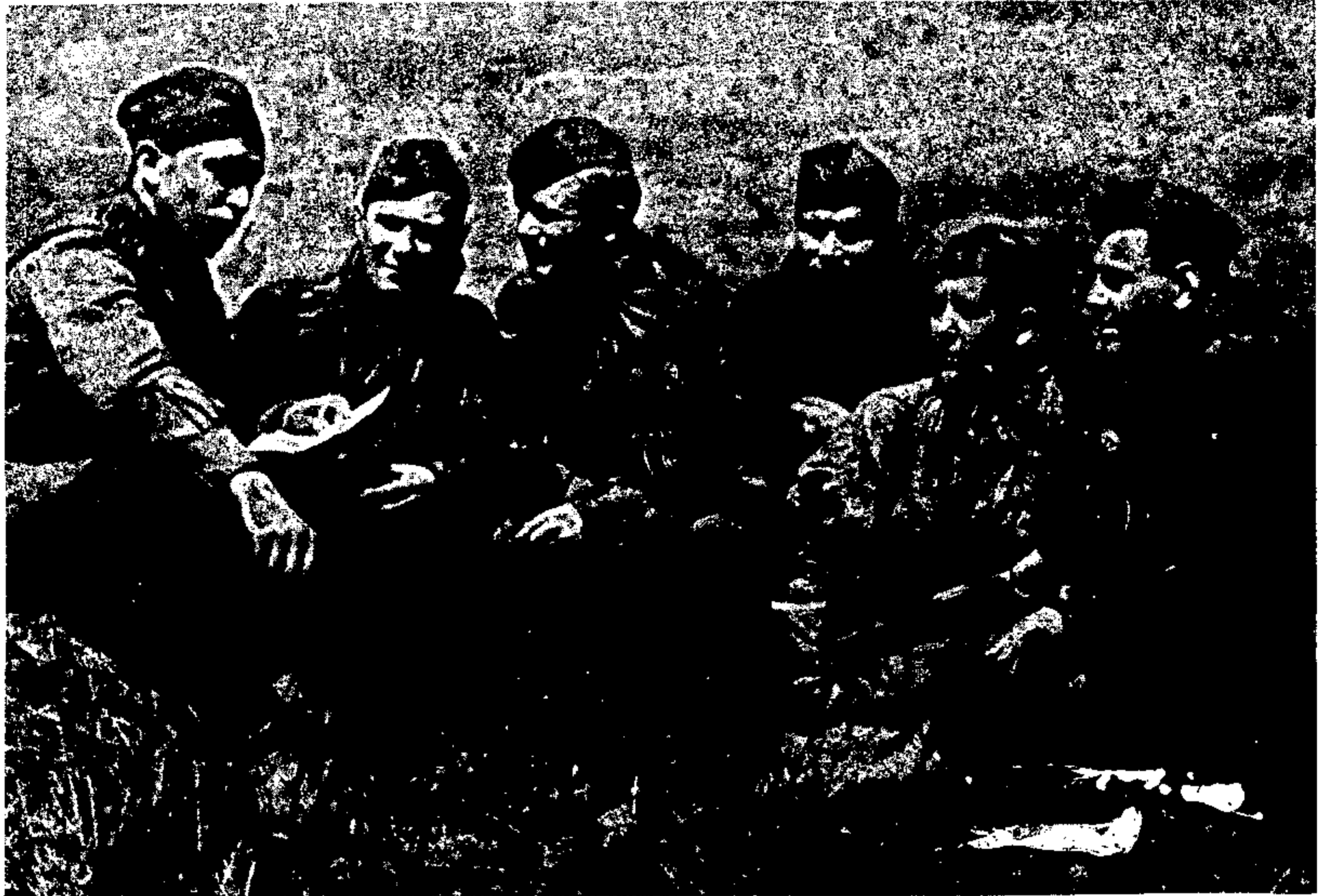
קצין וקבוצת חיילים של הדיביזיה הליטאית, יולי 1943.

להסתפק לפחות במבחר אופייני ומייצג של עובדות אלה לגבי כלל הלוחמים היהודים.