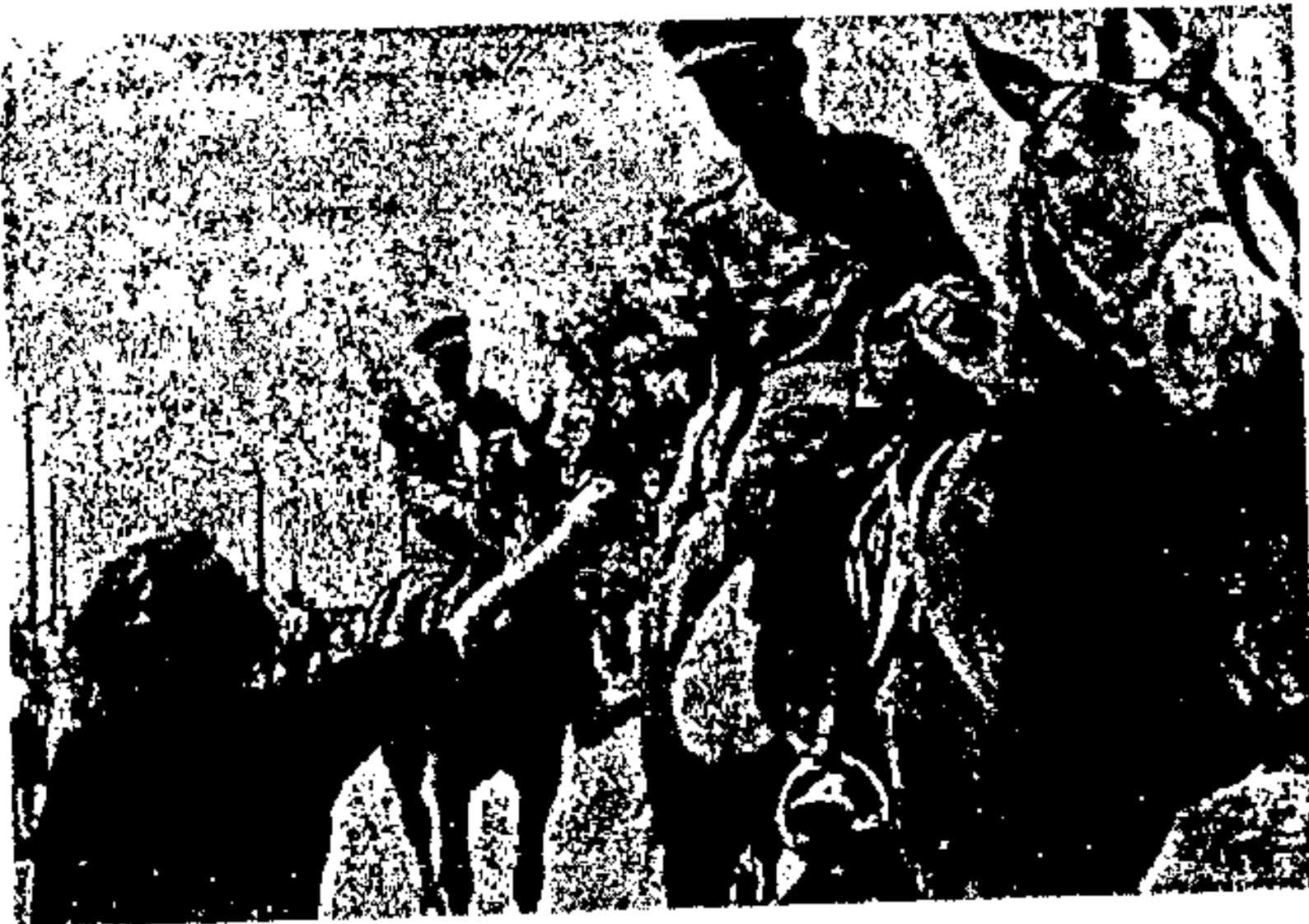
רס"ן לויטאץ (יהודי) בראש טור חיילי הדיוויזיה הליטאית, מקבל פרחים בוילנה המשוחררת

גבורוב אל מפקד של קבוצת הגייסות הקורלאנדית ובו הוא מציע להיכנע עד ה-8.5.1945, וזאת משום שבעיר ריימס נחתם כבר ב-7.5.1945 מיזכר על כניעה מוחלטת של גרמניה ואם יסרב - יושמדו, אך אם ייכנע - יושארו בחיים ויקבלו מזון ועזרה רפואית.