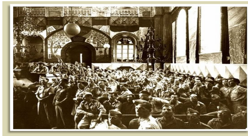
חיילים בבית הכנסת 'החורבה'