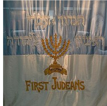
דגל הגדוד העברי