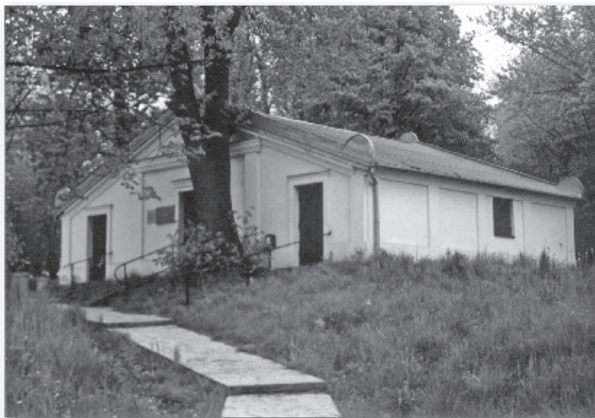
ציונו של ר' אלימלך מליז'נסק תע"ז- תקמ"ז (1717-1787)

ר' נפתלי רצה להיכנס לביתו של ר' אלימלך ונדחה בכוח. סיטואציה דומה מתרחשת כשר' אלימלך רצה להיכנס לחתונה, אך נדחה בדרך מכובדת ומנומקת על ידי שמשו.