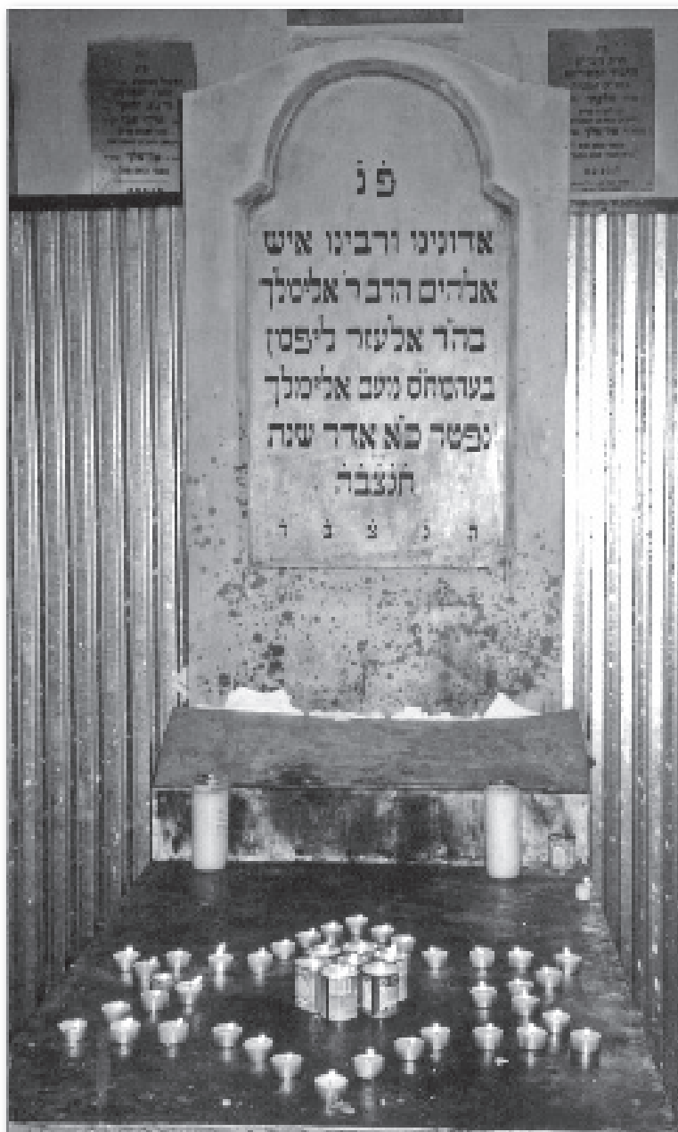
מצבתו של ר' אלימלך מליז'נסק