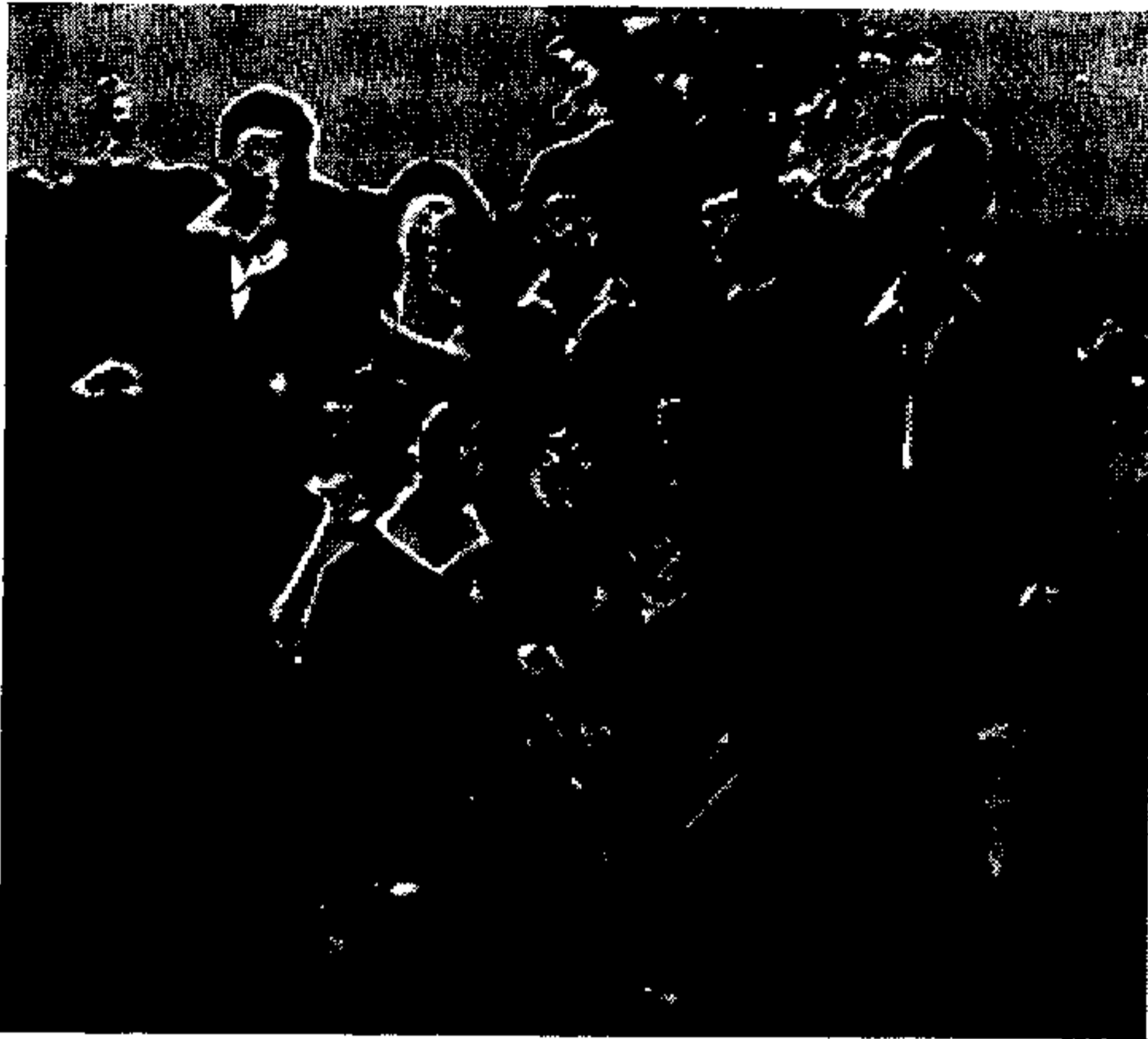
קבוצת נוער של ארגון ברית ציון (אב"צ) בגיטו.