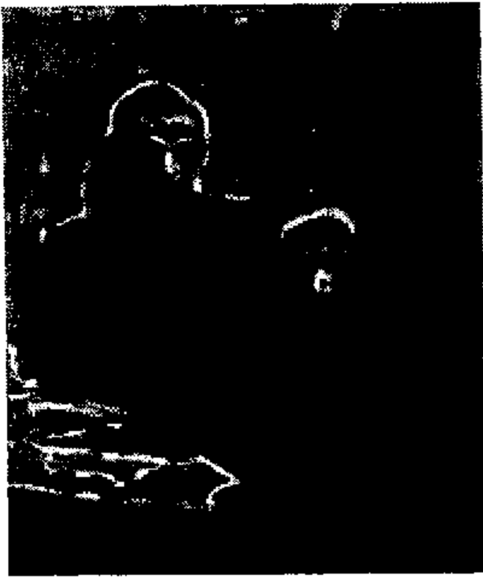
חיים ילין ואיש הארגון הלוחם משה מוסליס בעת אימון בנשק בדירה סודית.