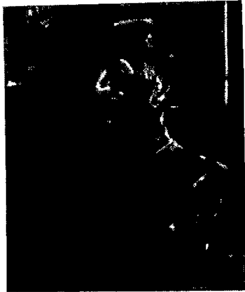
פסלו של חיים ילין, ממפקדי הארגון הלוחם של יהודי קובנא, שמאז תום המלחמה ועד 1948 היה מוצב במוזיאון התנועה הפארטי- זאגית בוויילנא. מאחורי הפסל נראה לוח- שיש, שחרוטים בו בידיש שמותיהם של לוחמי גיטו קובנא שנפלו.