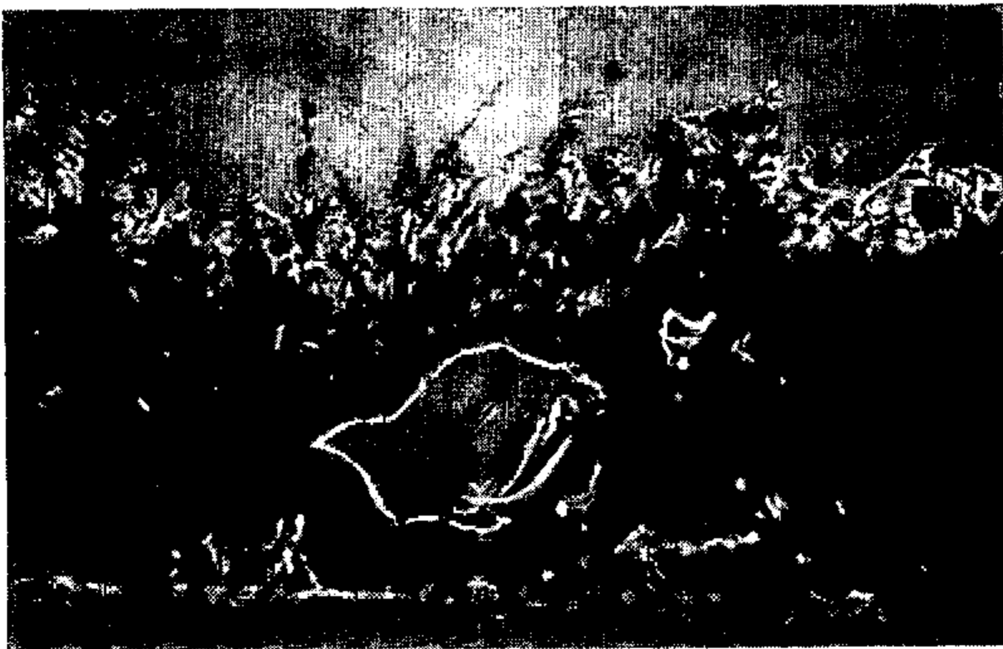
חיים ילין וחיים דוד ראטנר, שהיה מדריך צבאי בארגון הלוחם — במקום מפגש סודי על שפת הנהר ויליא.