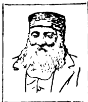
א. ב. גאטשעט