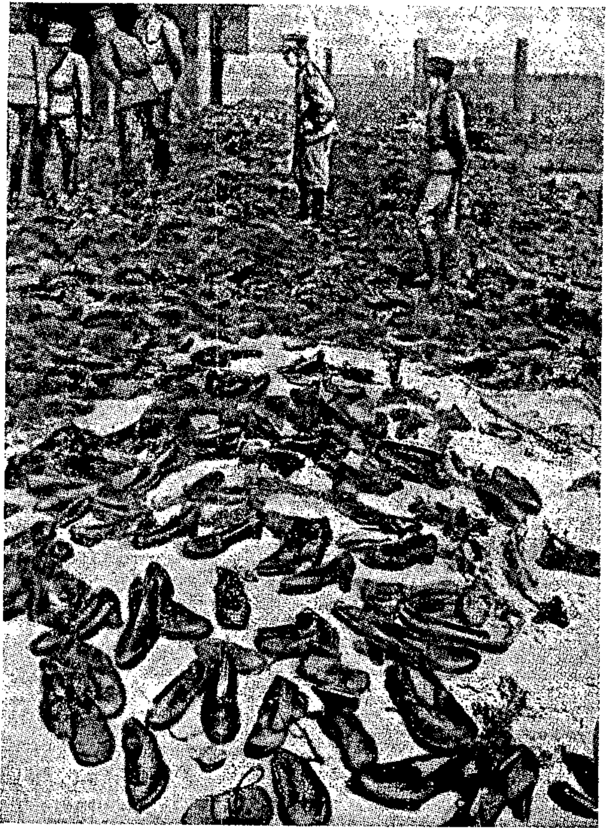
ערימת - בעלים במחנה מיידאנק