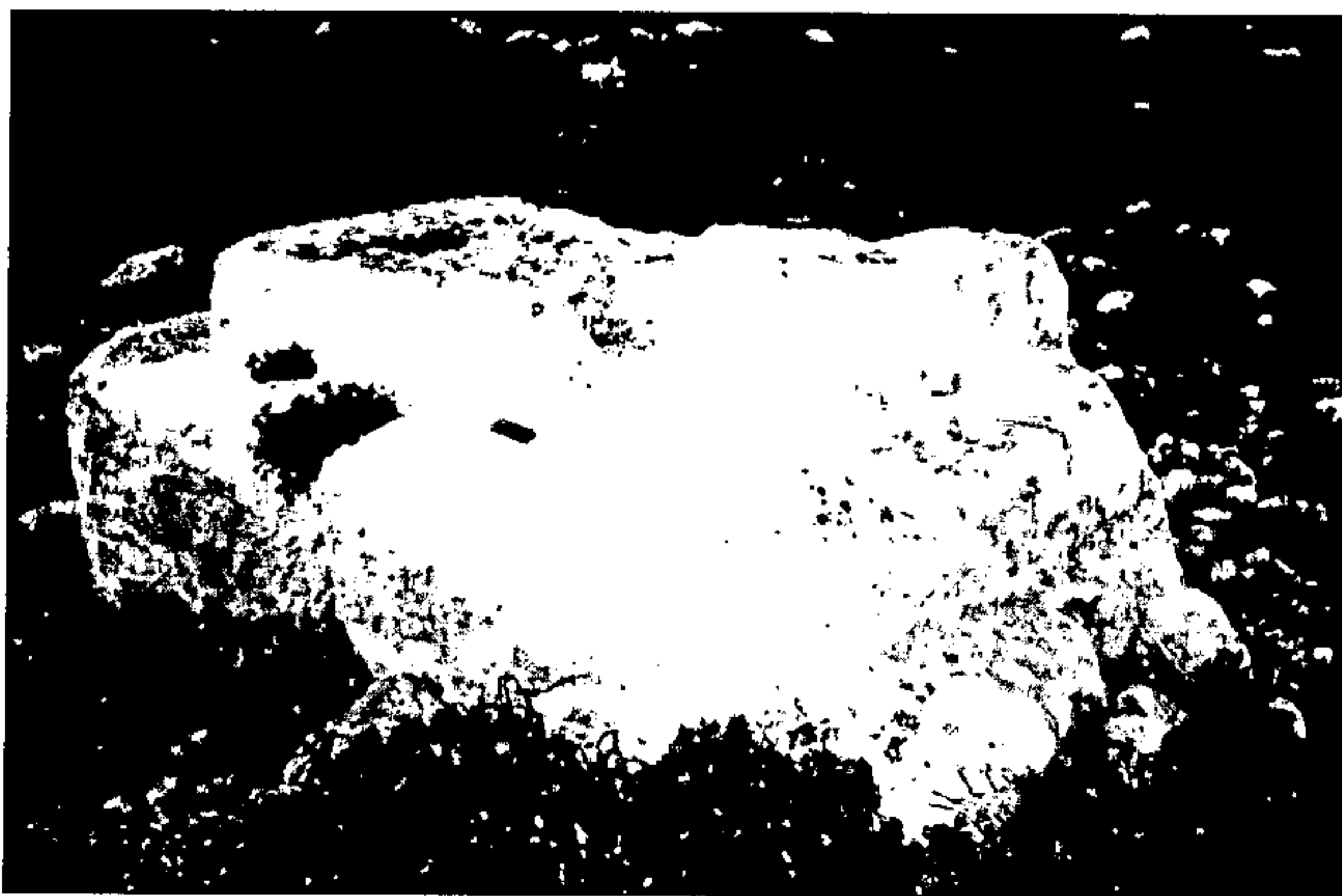
איור 7: "מזבח מנח" שליד צרעה הקדומה

אם מוציאים מכלל הדיון חציבות שונות, שחוקרים הלהוטים אחר שרידים "פולחניים" זיהו אותם כמזבחות, ולא מביאים בחשבון את ממצאי פטרה הנבטית, המשקפים עולם שונה מבחינת הזמן, המקום והתרבות החומרית, אפשר לקבוע, שמזבחות ברורים החצובים בסלע הטבעי נודעו עד היום בארץ-ישראל בשני מקומות בלבד: בשומרון (סבסטיה) ובצרעה (איור 7). האחרון שוכן תחת חורבת צרעה הקדומה, כיום בקצה אזור התעשייה