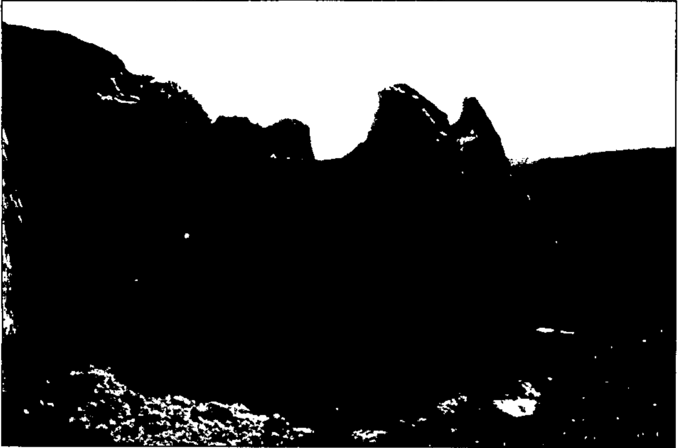
איור 1: מראה כללי של המזבח החצוב