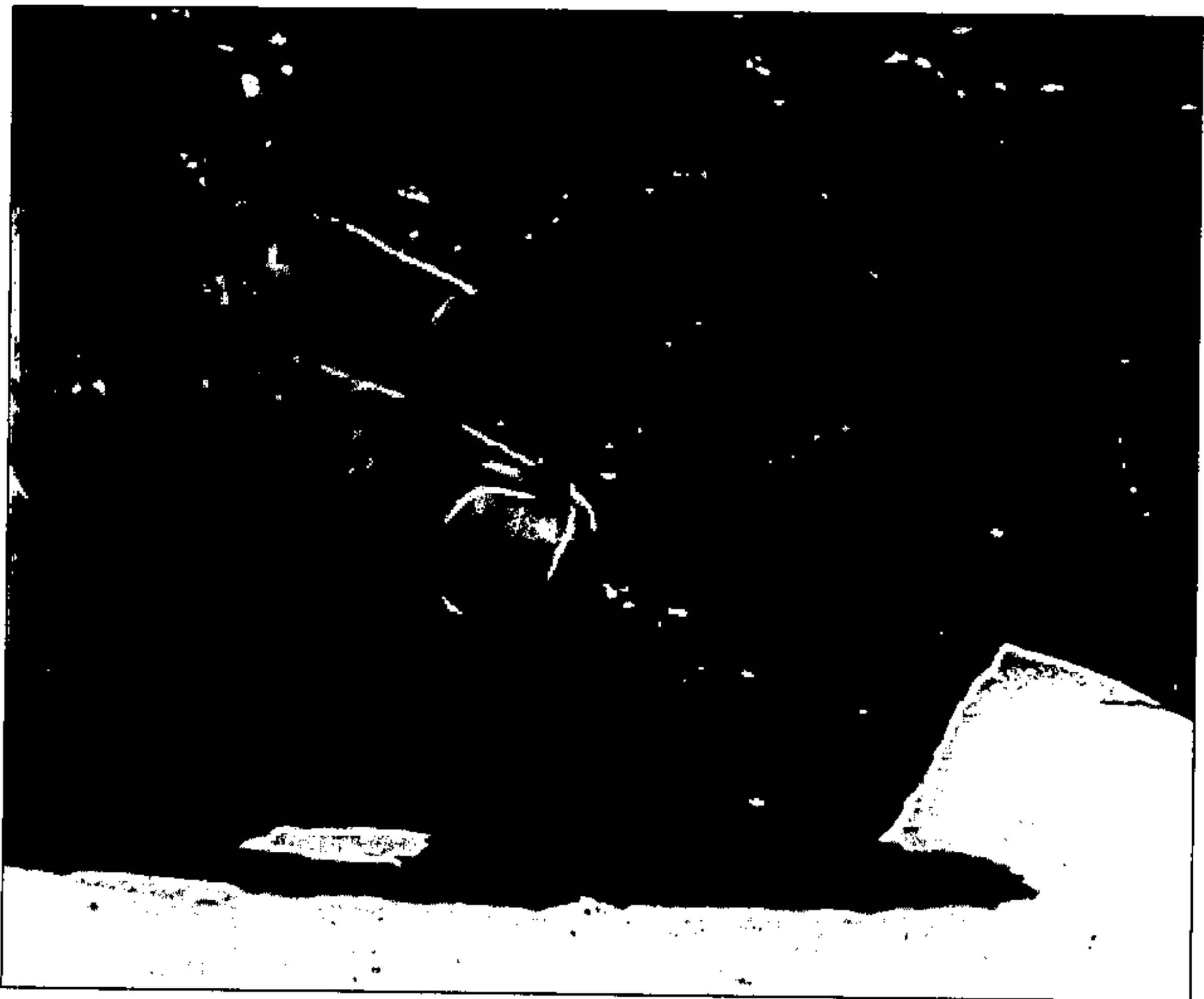
איור 6: האבן המפוחמת, שניתקה מראש המזבח

שנמדדו הם: דרום-מזרח: 2.70 מ', 2.20 מ' ו-1.70 מ'; צפון-מזרח: 1.80 מ', 1.20 מ' ו-1.80 מ'; צפון-מערב: 1.95 מ', 1.80 מ' ו-2.75 מ'; דרום-מערב: 3.20 מ', 2.50 מ' ו-3.20 מ'. גובה הקרנות: 53 ס"מ במזרח, 37 ס"מ בצפון, 75 ס"מ במערב ו-65 ס"מ בדרום והיקפן: 2.68 מ' במזרח, 2.32 מ' בצפון, 2.95 מ' במערב ו-2.80 מ' בדרום. זוויות המזבח מכוונות לארבע רוחות השמים: צפון, דרום, מזרח ומערב, וצלעותיו לחצאי-כיוונים: צפון-מזרח, צפון-מערב, דרום-מזרח ודרום-מערב. למרגלות המזבח, במרחק כמטר אחד מצד דרום-מערב, נמצאה פיסת סלע מושחרת, הנראית כחלק מן הקרום הקשה שהיה על גג המזבח (מידותיה כ-8 X 7 ס"מ ועובייה 2-3 ס"מ (איור 6). ניכר בה שנשרפה בחום גבוה מאוד ומראיה דומה לאבנים הנמצאות לעתים קרובות בקרבת כבשני סיד.