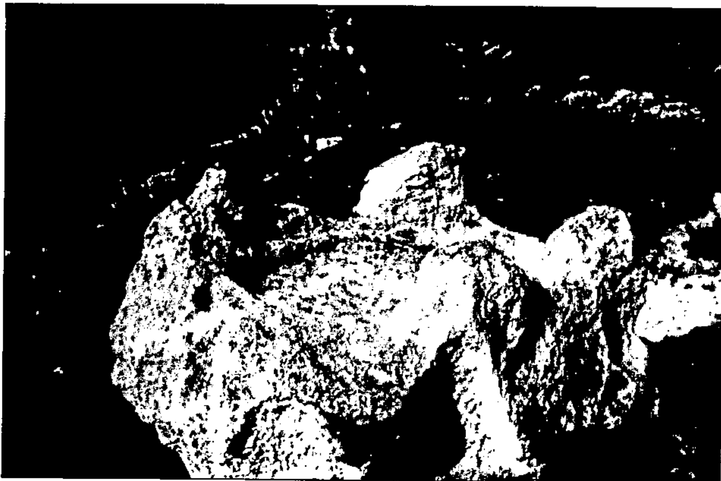
איור 3: חלקו העליון של המזבח עם הקרניים

המזבח ניכרות ארבע קרנות ובגגו – סימני יישור מלאכותי, היוצרים זווית ישרה בין הקרנות ובין מקום מערכת האש שעל גג המזבח (איורים 3 ו-4). הצד החיצוני של המזבח אינו מיושר היטב וניכרת בו בלייה לא מעטה. גג המזבח אינו ריבוע שלם. ייתכן שהסתתים נאלצו להסתפק בריבוע חלקי בשל נתוני הסלע הטבעי (תופעה דומה ניכרת במזבח מנוח