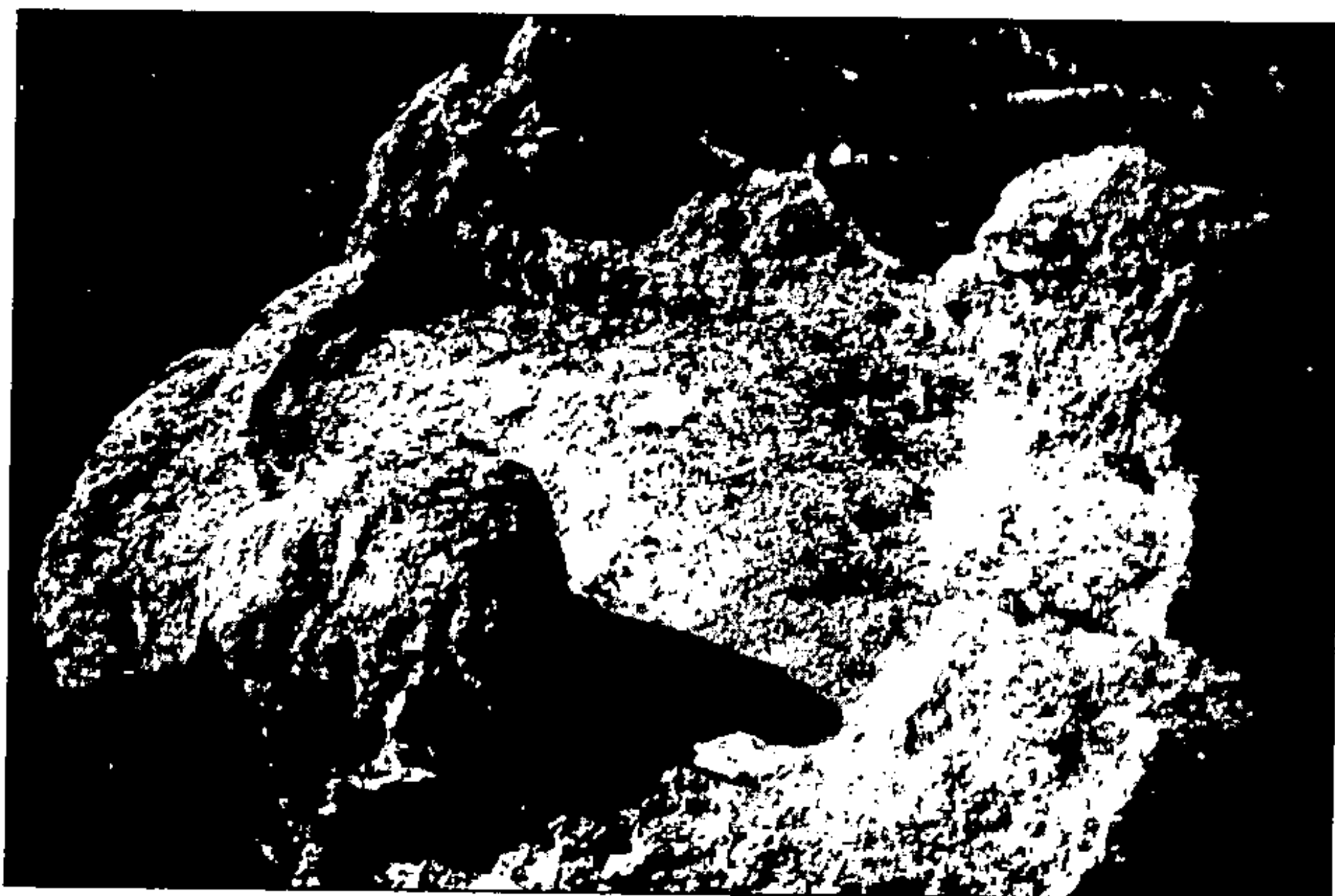
איור 4: מבט מקרוב על קרנות המזבח