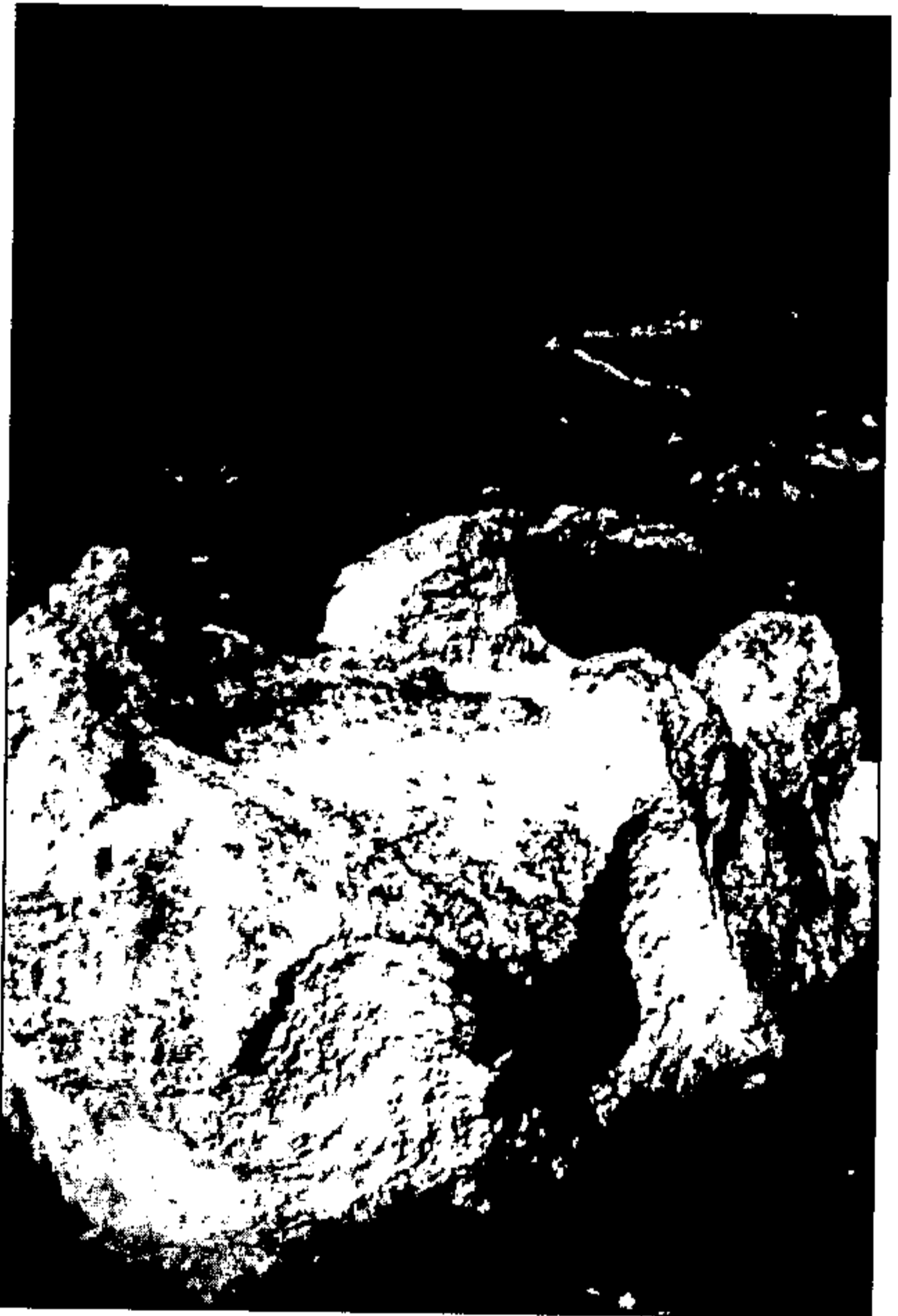
איור 5: מבט אל המזבח מכיוון מזרח

שבצרעה, המתואר להלן). המזבח ממוקם כאמור במדרון ההר ולכן גבוה צדו הדרומי-מערבי כמעט כפליים מצדו הצפוני-מזרחי. בחלק הימני של הצלע הדרומית-מזרחית יש בליטה מעוגלת ובצדה, בפינה המזרחית, ניכרת פגימה שרוחבה כמטר אחד (איור 5), הפוגעת במקצת במראה המרובע של המזבח.