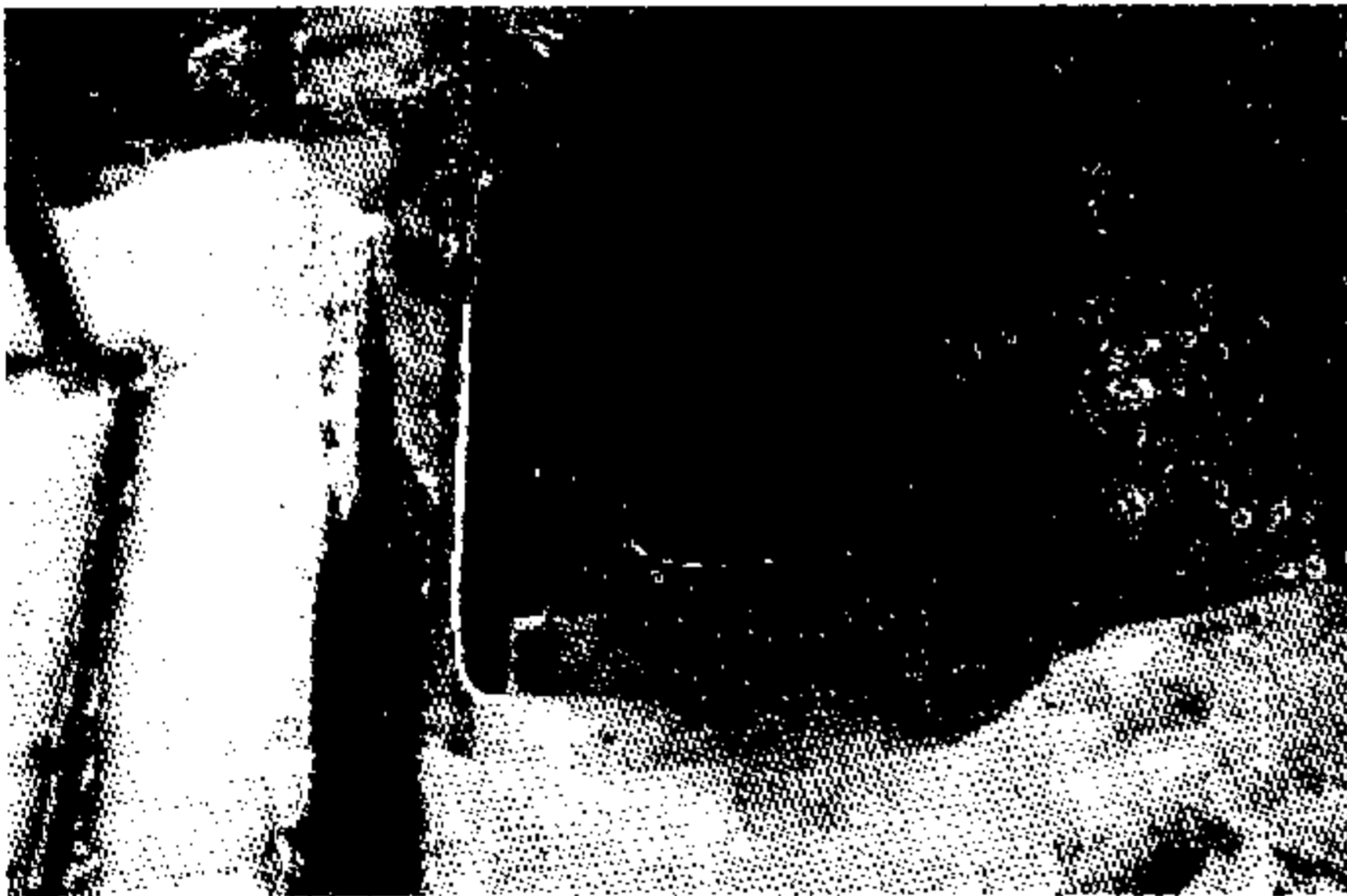
מקווה שאינו ראוי לטבילת אדם בבית המידות ברובע הרודייני

פורסמה בשנת תש"ל ואשר לא היו לה מהלכים לאחר מכן, שהמקוואות הוכשרו על ידי הוספת מים למקווה כשר וגלישתם למקווה ריק, וכדברי המשנה, 'היה בעליון ארבעים סאה ובתחתון אין כלום ממלא בכתף ונותן לתוכו עד שירדו לתחתון ארבעים סאה'. 3