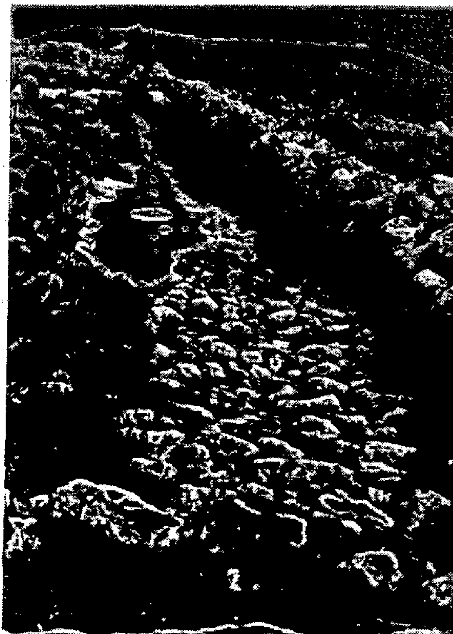
איור 2: שרידי מעלה בית-חורון הקדום מדרום לכביש הישן, ממערב לבית עור אל-פוקא

חשיבות מיוחדת יש לאופי השרידים; אלה הם ממצאים, המתאימים לדרך ממלכתית, המטופלת על-ידי שלטון מרכזי, ולא למשעול כפרי מקומי. מדובר בקטע אחד בראש המעלה (סמוך למערת בית-הבד המיוחדת שהשתמרה כאן; ראה אליצור, תשמ"ו) הנמשך לאורך כמה עשרות מטרים, שהשתמר בו ריצוף אבנים שלם כמעט (איור 2). לאחר מכן, בתחילת המורד, מצויות שתי נקודות (אחת מהן לא נפגעה עד לזמן כתיבת שורות אלה) של בנייה באבנים, הממלאת פחת בסלע הטבעי והיוצרת מעין כבש, הראוי לשפיכת עפר כבוש על גביו (איור 3). בהמשך הירידה ניתן להבחין בטרסה, שעליה עברה הדרך, ופה ושם באבנים גדולות, שליוו אותה מצדה הצפוני, המתון. רוחב הדרך כארבעה מטרים והיא עוברת בראשו של המדרון התלול למדי של ואדי א-דבוב (על-פי מפות 1:50,000 ישראל), שעל גדתו הצפונית עובר כיום הכביש החדש.