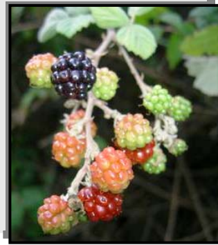
"אשכול" פטל קדוש (ענבי הסנה)