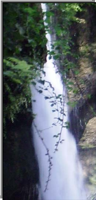
פטל קדוש שגדל במפל