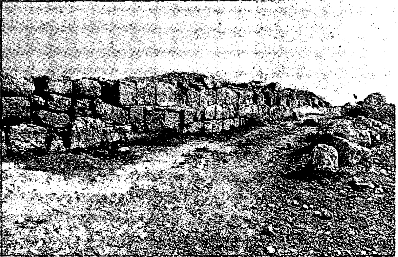
איור 4: חרבת סוסיא - הקיר הדרומי של בניין A

הזווית הכהה בין הקירות יצרה מרחק של כ־20 מ' מן הקבר החצוב, שנמצא מדדום למבנים אלה. נראה שבונייהם מצאו את הקבר החצוב (מבית־הקברות הקדום של העיר) ונהגו לפי הכלל המחייב להרחיק את בתי המגורים מן הקברים שאינם מתפנים (תוספתא בבא בתרא פ"א 10). הקיר המערבי של בניין B גובל בדרך. מקיר זה צפונה מגבילים הקירות המערביים של המבנים האחרים את הדרך במורח לכל אורכה.