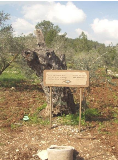
"יוצא חוטֵר מגזע ישי ונצר משורשיו יפריה", באתר "נאות קדומים"

9. עיין בפסוק א, ובפירושו דעת מקרא והסבר את הדימוי הנזכר בפסוק.