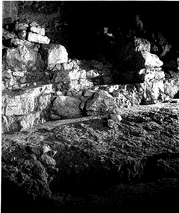
איור מספר 1: ביצור מהתקופה הכנענית שנחשף בחפירות החדשות ליד מעיין השילוח.

לא רק שלא ישפוך סוללה ולא יכבוש את ירושלים - הוא גם "לא יורה שם חץ ולא יקדמנה מגן". כלומר, האויב לא ימלא את מורדות הר הזיתים בקשתיו ובקלעיו ולא