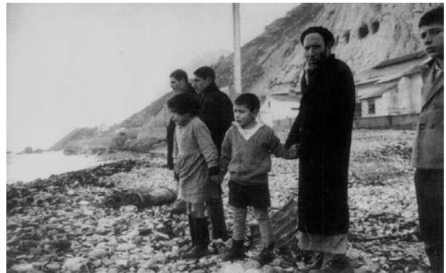
ממתנים בצפייה לספינה

כל אלה לא סיפקו את נציגי ישראל, שחיפשו דרכים נוספות להפנות את דעת הקהל נגד מרוקו. במוסד לתיאום, שהורכב מנציגי הממשלה והסוכנות היהודית, הועלתה הצעה ליזום כינוס עולמי לא יהודי למען הקהילה במרוקו, כמו הכנס שנערך בפריס למען אוטונומיה תרבותית ליהודי ברית המועצות. שרת החוץ התייעצה עם גולדמן כדי לבדוק את סיכויי ההצלחה ואת דרכי הביצוע, וראתה בכנס מסוג זה "ניסיון אחרון" להשפיע על ממשלת מרוקו. 18 מאחר שהתנהל כבר מסע הסברה, וכיוון שעמדותיהם של ראשי קי"ע ושל ארגונים יהודיים אחרים זכו לפרסום נאות בעיתונות, החליטו נציגי