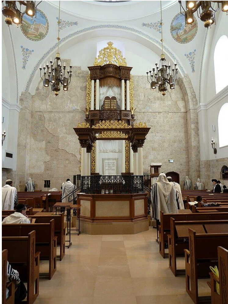
ארון הקודש בבית כנסת החורבה, ירושלים. יוצר: