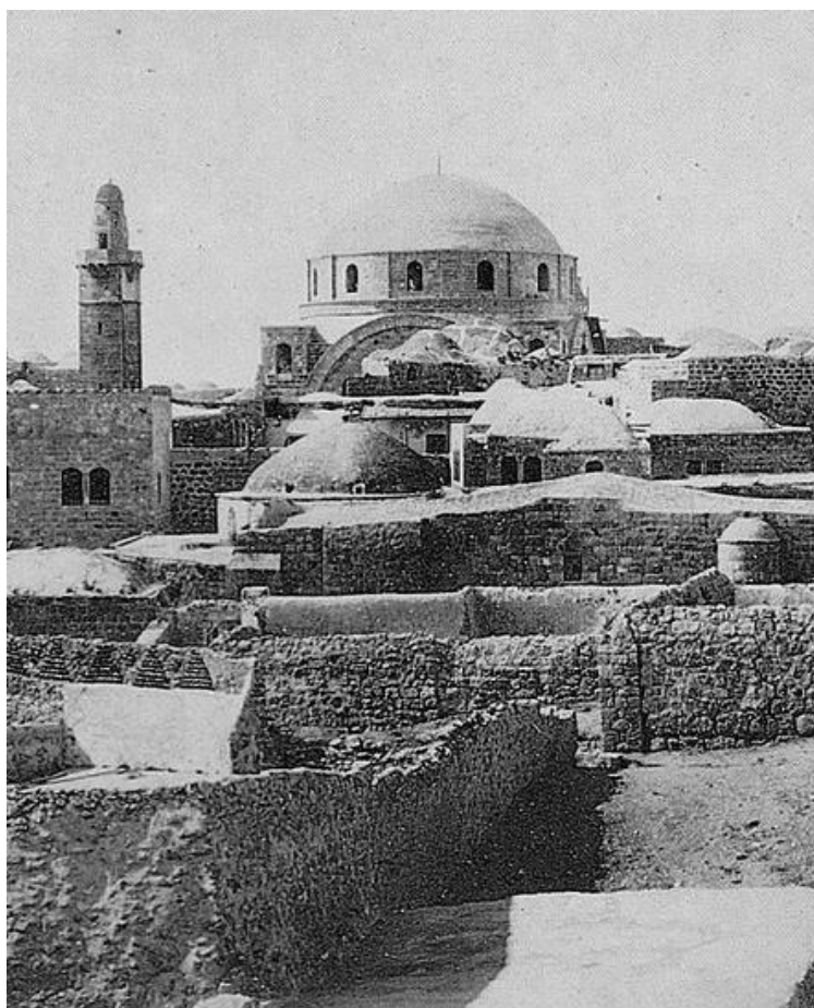
בית כנסת החורבה, בעיר העתיקה בירושלים. נבנה במאה ה-18 ע"י העולים עם רבי יהודה החסיד, ונחרב בשל חוב לבנאים הערבים. נבנה שנית על ידי תלמידי הגר"א וחרב במלחמת השחרור. נבנה בשלישית לאחר שחרור העיר העתיקה.