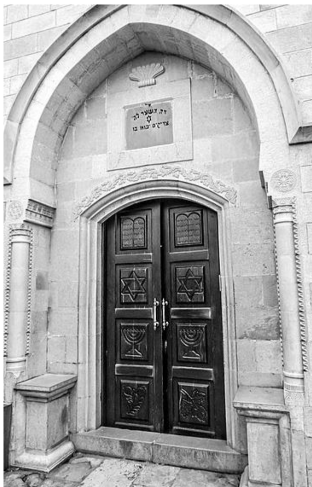
בית כנסת אבוהב בצפת.