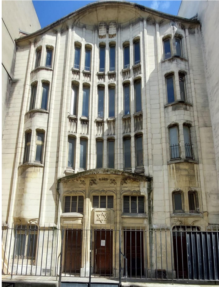
בית כנסת Rue Pavée בפריז.