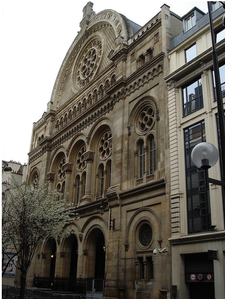
בית הכנסת הגדול, פריז.