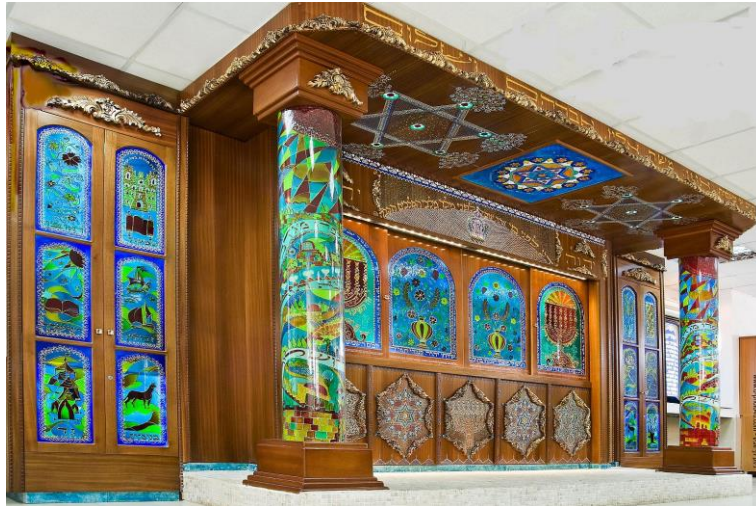
בית הכנסת עמית בנתניה, בנוסח תוניס. היוצרת שרה קונפורטי