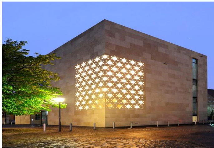
בית כנסת בעיר קלן