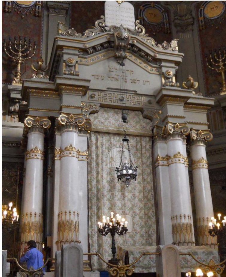
ארון הקודש בבית הכנסת הגדול ברומא.