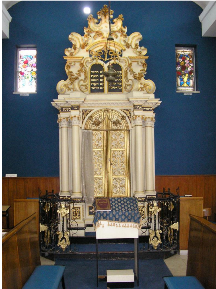
ארון הקודש האיטלקי, בהיכל שלמה ירושלים