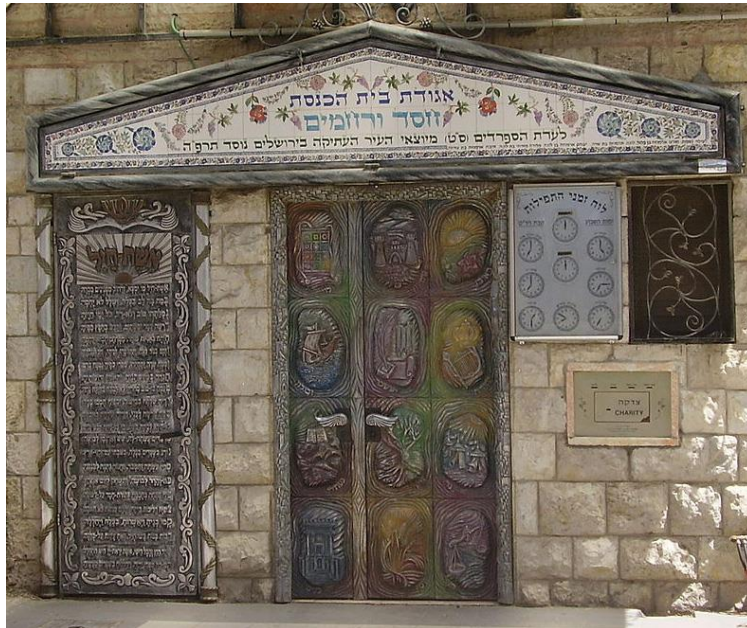
בית הכנסת חסד ורחמים, בשכונת מזכרת משה, מול הכניסה לרחוב אגריפס בירושלים.