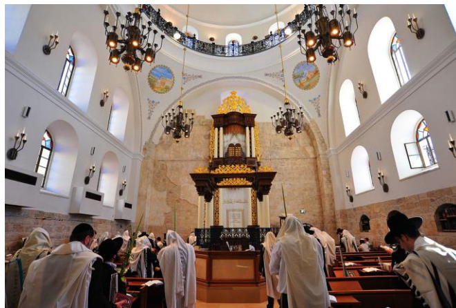
בית כנסת החורבה, ירושלים.