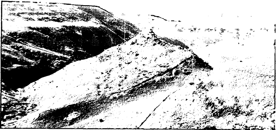
איור מספר 2: גמלא - דרך העלייה המוצעת משביל הגישה (א), דרך המדרגות הישנות (ב) והמגדל הצפון מזרחי (ג), עד לראש המצוק (ד).

אשר למקום הדיון, כפי שבית הכנסת ובית המדרש שימשו זירה לדיון בתורתה של גמלא, כאן מומלץ להגיע עם החניכים היישר לראש המצוק (ניתן להגיע במדרגות ישנות הנמצאות ליד מחנה העובדים, דרך הצד הצפוני של המצוק), ללא כניסה לעיר עצמה, דרך המגדל בפניה הצפון-מזרחית של החומה (ראה איור מספר 2). כאן בראש המצוק, לנוכח התהומות האדירים שאליהם קפצו המתאבדים, נספר את סיפור הקרב האחרון של גמלא. בעקבותיו ניתן לפתח דיון מעמיק. נושא זה יכול גם לבוא בסיום הסיור בעיר, כסיכום לסיור כולו. אם כך ננהג, שאלת מקום הדיון אינה כה חשובה.