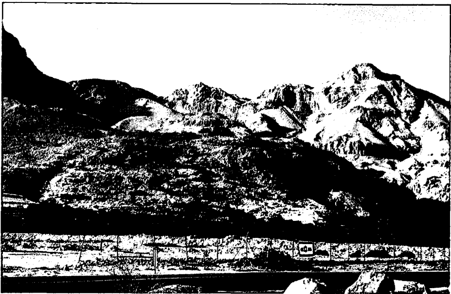
איור מספר 2: נאת עין גדי - אזור המדרגות החקלאיות שמתחת למעיין עין גדי. ייתכן שבאזור זה גדלו בעבר עצי שקמים.

וממצאים ארכאולוגיים שלא כאן המקום לפרטם. לענייננו חשוב להדגיש את דבר קיומה של דרך ישראלית חשובה שקישרה את אזור תקוע עם אזור עין גדי, 27 ואין זה מן הנמנע שעמוס יכול היה לעשות את דרכו בפרק זמן קצר לאורך הדרך לעין גדי. אם הממצאים שציינו למעלה, שחלקם מתקופת הבית השני, רומזים לגידול שקמים באותה העת בעין גדי, ומתוך הנחה סבירה שבתקופת המקרא הנוף הטבעי באזור עין גדי היה כמו בתקופת הבית השני, לא נהיה לדעתי רחוקים מן האמת אם נאמר שעמוס הנביא רעה את צאנו ובקרו בספר המדבר ועסק בבליסת שקמים בנאת עין גדי (ראה איור מספר 2). בשתי המלאכות יכול היה הנביא עמוס לעסוק במקביל באותו אזור, המרוחק מתקוע רק מספר שעות הליכה בדרך המחברת את תקוע עם עין גדי.