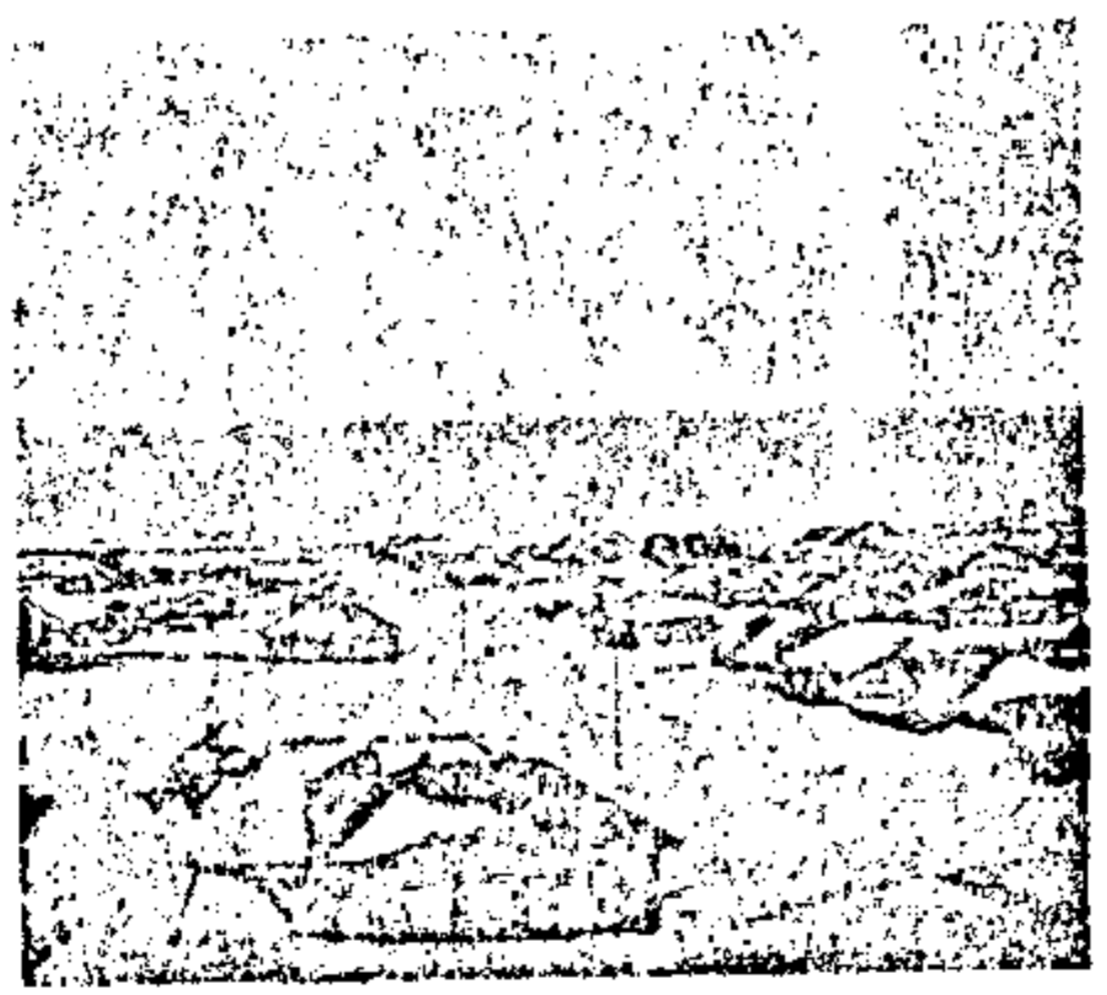
ישוב אסירים בסיביר

זית בלבד. הקשר עם שאר חלקי רוסיה התנהל אז בעיקר על-ידי שיירות אניות, שהגיעו שלוש פעמים בשנה.